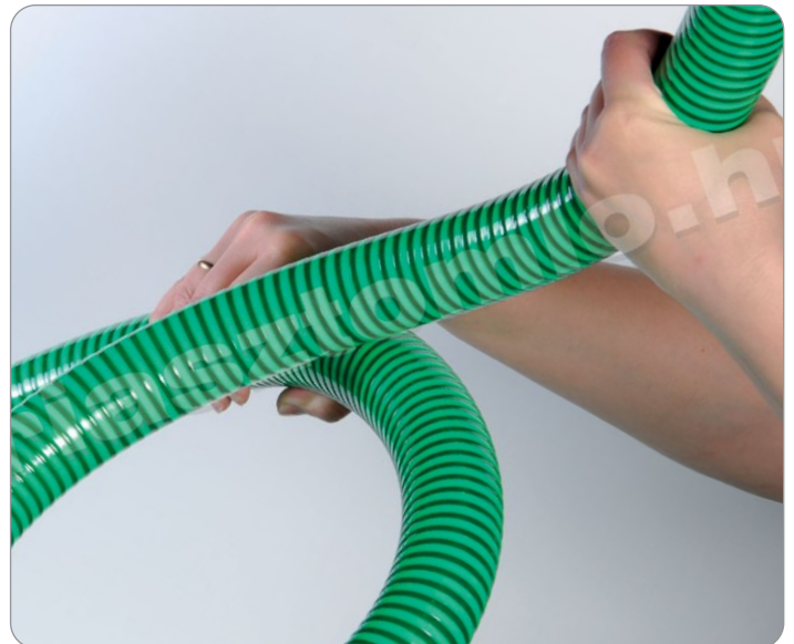
Cosmo Elastico tömlő